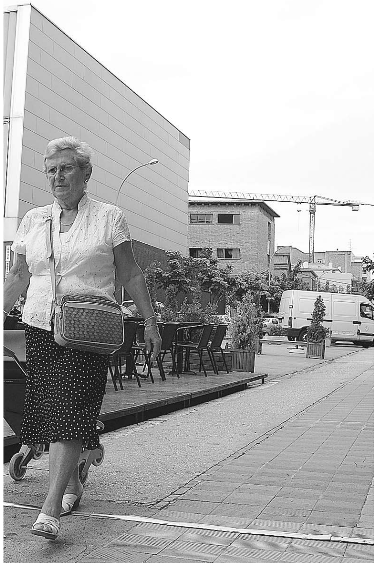
PLAÇA DEL SOL. Els marxants accepten parar en aquest indret

rà a construir el segon, al Passeig Nou. La previsió és que les obres comencin l'any vinent. Segons el calendari municipal, les obres no es podrien començar a licitar fins al 5 d'octubre. ■