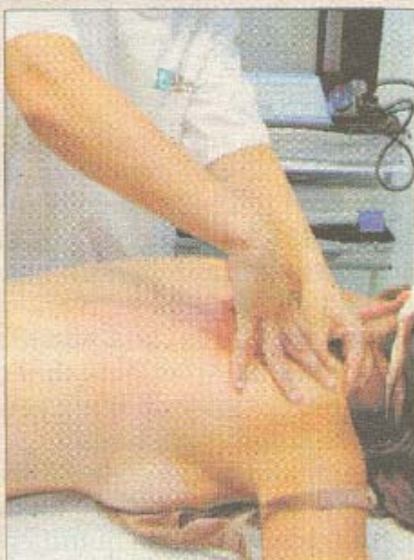
►► Taller de massatge.