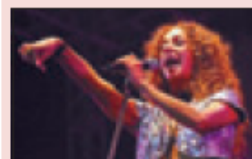
>>> La cantant Rosario.