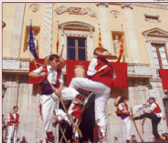
>>> Espectacle a la plaça de la Font, ahir.

Santa Tecla s'acomiarà demà, diumenge, amb un correfoc en què participaran una desena de grups de diables (plaça de la Mitja Lluna. 22.30 hores) i focs artificials (rambla Nova. 0.15 hores). Informació, a www.ajttarragona.es .