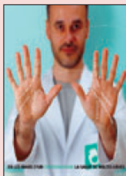
>>> Cartel de les jornades.

Amb motiu del Dia Mundial de la Fisioteràpia, aquest cap de setmana s'instal·larà una carpa divulgativa al parc de la Ciutadella. Hi haurà jocs, tallers, conferències i demostracions. En aquesta edició s'hi promocionaran diferents camps com la pediatria, l'aparell respiratori o les teràpies no convencionals. Destacaran els tallers de tai-bi i de massatge xinès (avui i demà, a les 17.00 h.). Demà, diumenge, hi haurà una conferència sobre higiene postural (18.00 h.). A més, s'hi donaran massa'tges gratuïts a tots els que ho desitgin. H.L.