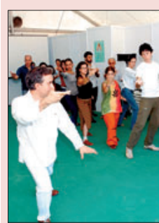
»» Sesión del 2004.