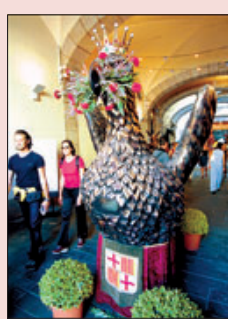
»» Exposición del año pasado.

Libros Más de 45 estands se reúnen en la 54ª edición de la Fira del Llibre d'Ocasíó Antic i Modern, con cerca de 150.000 títulos, entre ellos saldos y piezas de coleccionista, a precios que oscilarán entre uno y 6.000 euros. Paseo de Gràcia (plaza de Catalunya / Consell de Cent). De 10.00 a 21.00 horas.